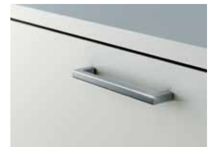
Zeitlos eleganter Stahlgriff