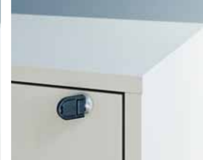
Lehmann-Wechselzylinder: für den einfachen Umbau