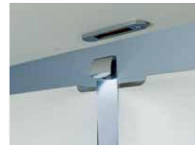
Patentierter Stahlfederclip: werkzeuglose Montage und Einbruchsicherung