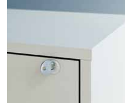
FIRST-Wechselzylinder: für höchste Sicherheit