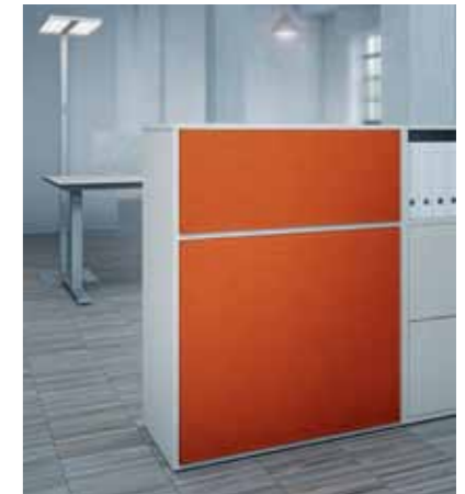
BuzziBack: Schallabsorbierende Filzrückwand aus recykliertem PET